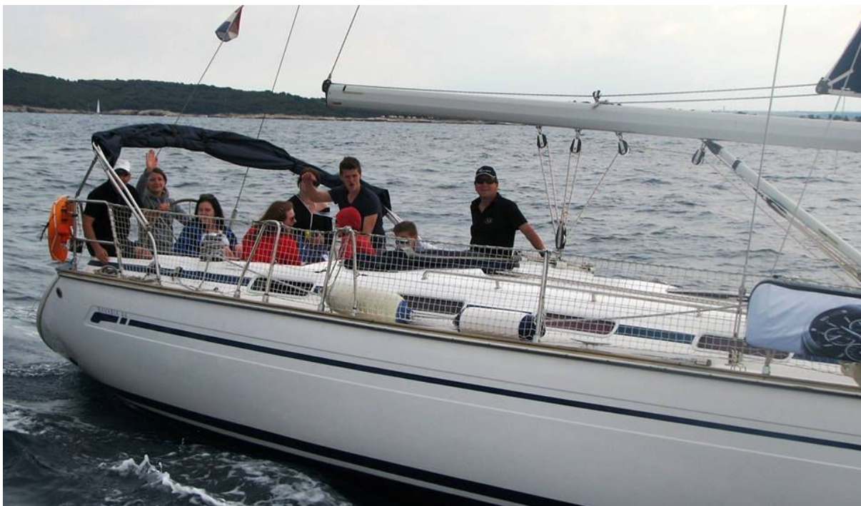
Naša jadrnica s posadko, Sea Cure.