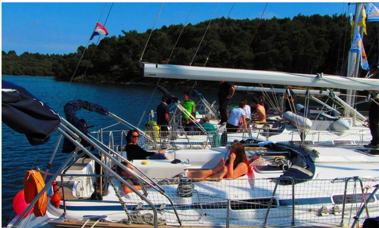
Po kosilu počitek, potem pa spet vesla, druženje, voda, pa jadranje, jadranje in jadranje... do onemoglosti...