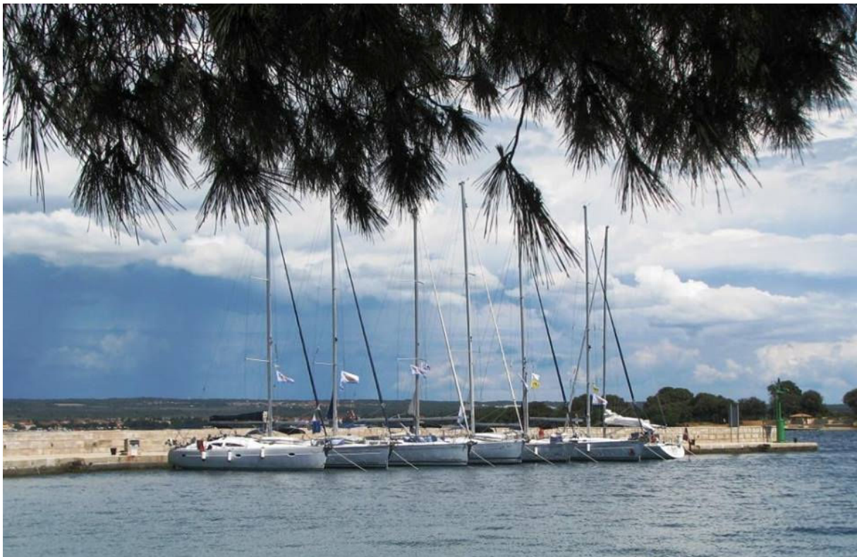
Privez na Brionih.