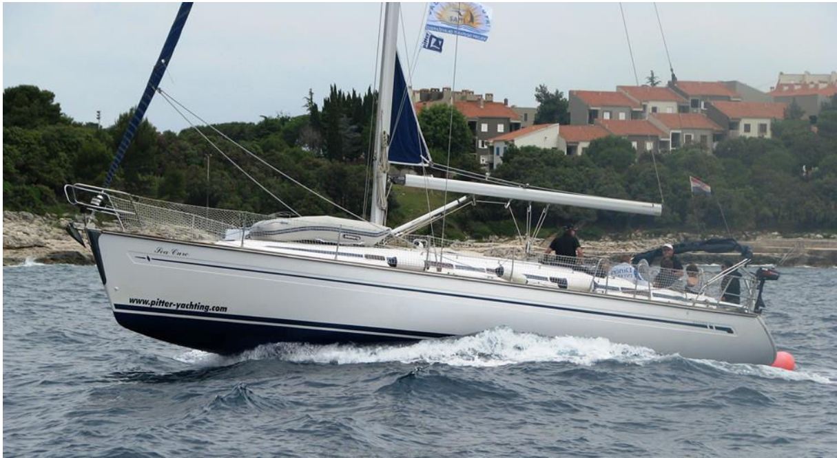
Odhod iz Verude v sonči in mirni zaliv.