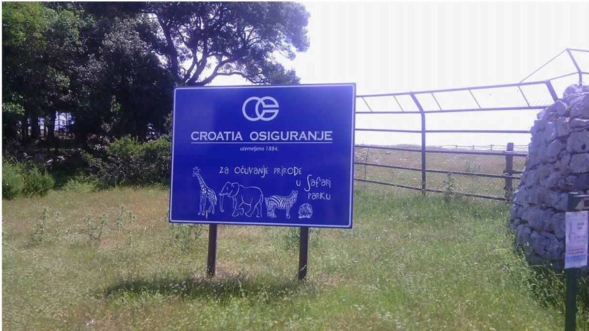
Safari park na Brionih.