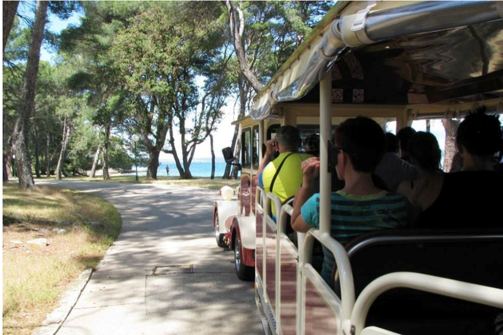
Vlavec po Brionih. Ogled parka.