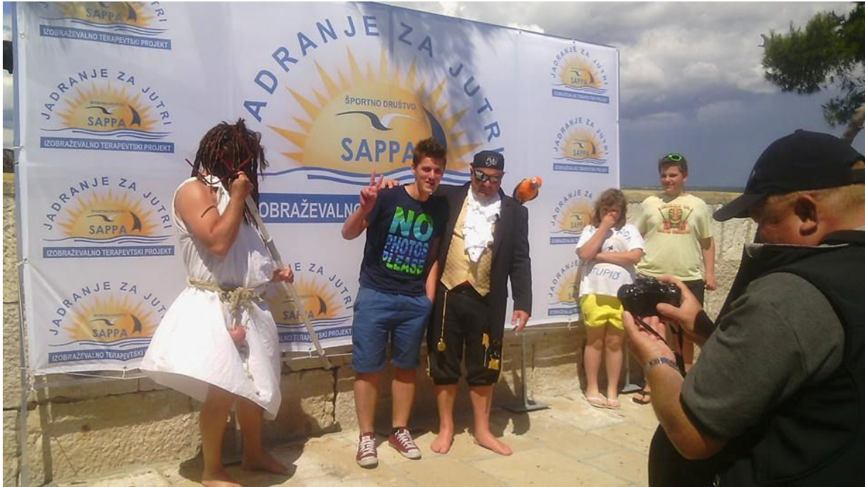
Jp. Zaprisegli Pozejdonu in kapitanu Kljuki.