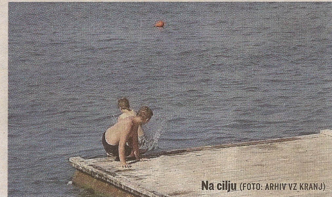
Na cilju